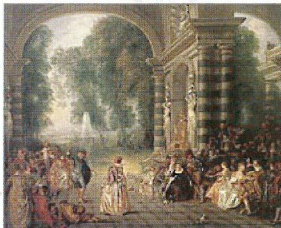
舞踏会の楽しみ Les Plaisirs du bal 1717年頃 アントワヌ・ヴァトー Antoine Watteau 1684-1721年 フランス