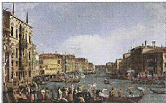
大運河でのレガッタ Regata sul Canal Grande 1730-35年 カナレット Canaletto 1697-1768年 ヴェネツィア